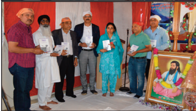
ਸ੍ਰੀ ਗੁਰੂ ਰਵਿਦਾਸ ਸਭਾ ਬੇ-ਏਰੀਆ ਵੱਲੋਂ ਮਹੀਨਾਵਾਰ ਸਮਾਗਮ। ਰਿਪੋਰਟ ਅਤੇ ਤਸਵੀਰਾਂ ਦੇਖੋ ਸਫਾ 16-17 'ਤੇ